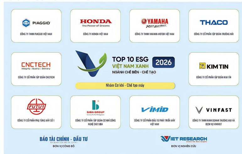
Bảng 1: Top 10 doanh nghiệp ESG Việt Nam Xanh 2026 – Ngành Chế biến – Chế tạo – Nhóm Cơ khí – Chế tạo máy