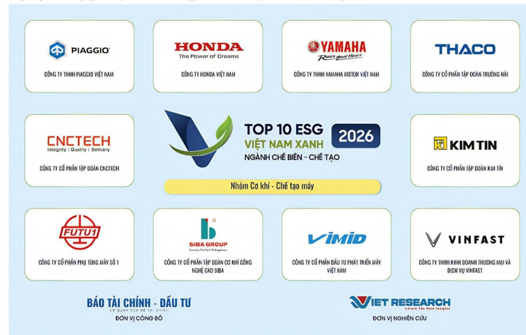
Bảng 1: Top 10 doanh nghiệp ESG Việt Nam Xanh 2026 – Ngành Chế biến – Chế tạo – Nhóm Cơ khí – Chế tạo máy